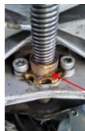
Boccola in ottone