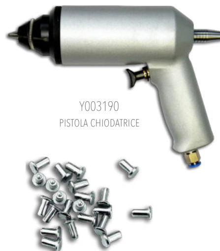
Y003190 PISTOLA CHIODATRICE