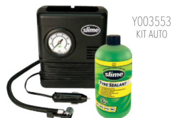
Y003553 KIT AUTO