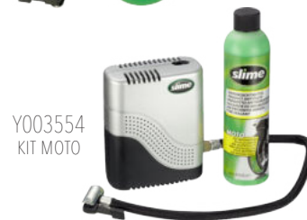
Y003554 KIT MOTO