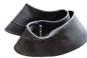
A002912 - A002913 - A002914 SOLO CAMERA D'ARIA